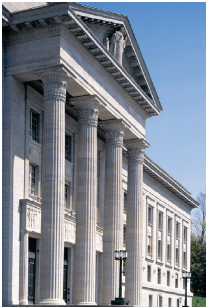
Zeigte ein Herz für die Anleger: Das Bundesgericht zwingt Banken und Vermögensverwalter dazu, ihre Provisionen offen zu legen.

Wirtschaftsanwalt Fischer rät in jedem Fall dazu, sich an einen spezialisierten Juristen zu wenden: «Die Materie ist zu komplex. Bis vor einer Woche wussten die wenigsten, was mit dem Wort Retrozessionen gemeint ist.» Damit spricht er den springenden Punkt des Urteils an. Das Bundesgericht hat die Anleger aufmerksam gemacht, die ihnen schon länger zustehen. Es hat einen schlafenden Hund geweckt. SEITE 4